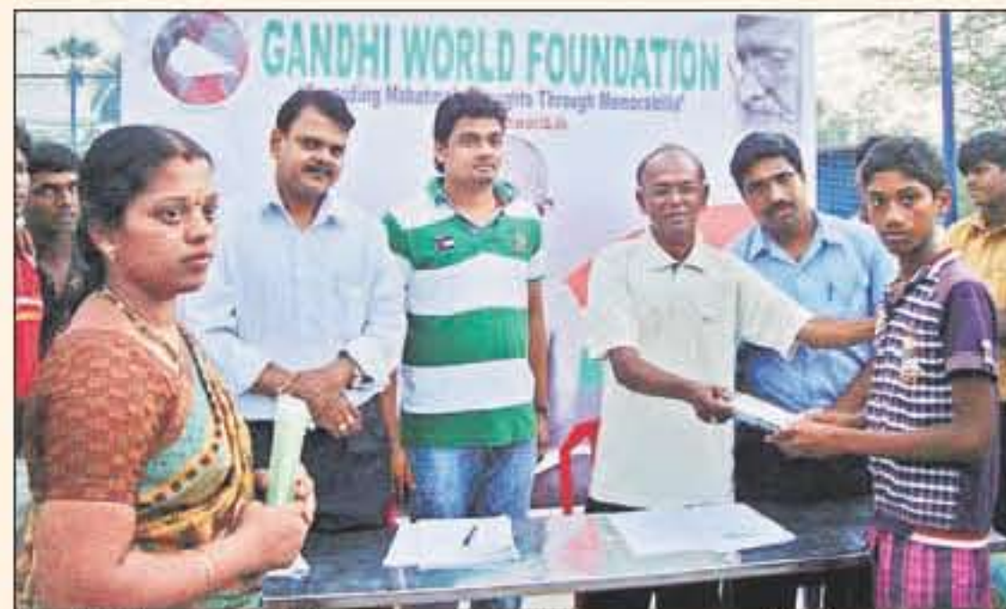
ఫౌండేషన్ ఆధ్వర్యంలో విద్యార్థులకు సహాయకాలు అందజేస్తున్న ధ్యక్షం