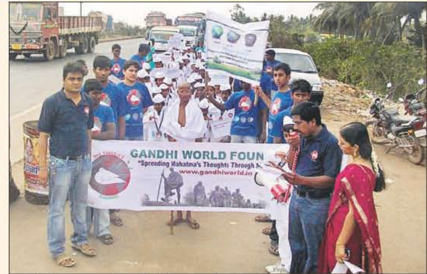
ఫౌండేషన్ ఆధ్వర్యంలో ప్లాస్టిక్ నిషేధంపై ర్యాలీ నిర్వహిస్తున్న చిన్నారులు

తీసేందుకు ఫౌండేషన్ ఆధ్వర్యంలో ఎంఎల్ఆర్ క్రికెట్ అకాడమి ఏర్పాటు చేసి ఉచిత శిక్షణ ఇస్తున్నారు. అలాగే, బాలలకు గాంధీజీ సిద్ధాంతాలు తెలియజేసేందుకు వ్యాసరచన, చిత్రలేఖనం పోటీలు నిర్వహించి వారికి బహుమతులను