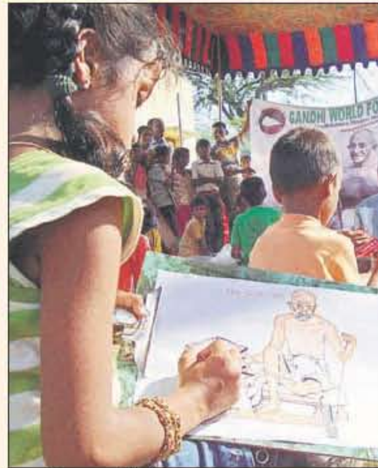
చిత్రలేఖన పోటీలో పాల్గొన్న విద్యార్థులు

అందుకోసం గాంధీజీ వరల్డ్ ఫౌండేషన్ ద్వారా ప్లాస్టిక్ నిషేధం, పర్యావరణ పరిరక్షణ, దేశ సమగ్రతకు, ఎయిడ్స్, బాల కార్మిక నిర్మూలన, మద్యపానం, ధూమపానం, అవినీతి రహిత సమాజం కోసం అనేక చైతన్య కార్యక్రమాలను నిర్వహిస్తున్నారు. అంతేకాకుండా గ్రామీణ ప్రాంతాల్లోని యువకుల్లో క్రీడా ప్రతిభను వెలికి